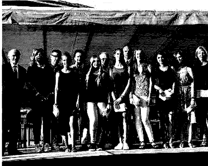
La cerimonia. Un gruppo di diplomati del Lunardi // FOTO NEG